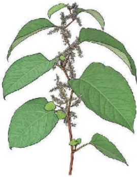
Asiatischer Staudenknöterich Reynoutria japonica

Entfernen Sie invasive Neophyten aus ihrem Garten damit sich diese nicht weiter in die Natur ausbreiten. Pflanzen Sie stattdessen einheimische Blumen, Sträucher und Bäume.