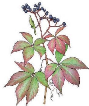
Fünffingerige Jungfernebe Parthenocissus quinquefolia