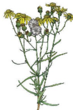
Schmalblättriges Greiskraut Senecio inaequidens