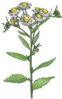
Einjähriges Berufkraut Erigeron annuus