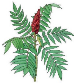
Essigbaum Rhus typhina