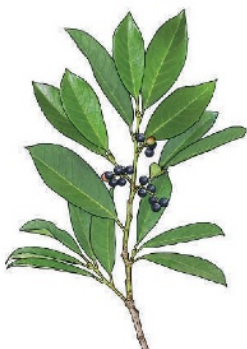
Kirschlorbeer Prunus laurocerasus