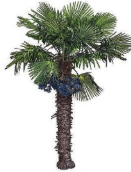
Chinesische Hanfpalme Trachycarpus fortunei