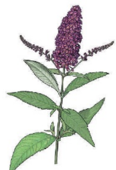
Sommerflieder Buddleja davidii