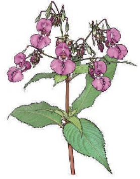
Drüsiges Springkraut Impatiens glandulifera