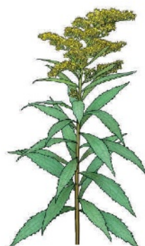
Nordamerikanische Goldruten Solidago canadensis, Solidago gigantea