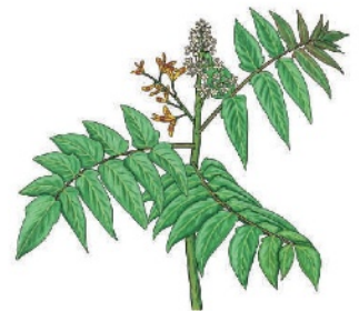
Götterbaum Allanthera altissima