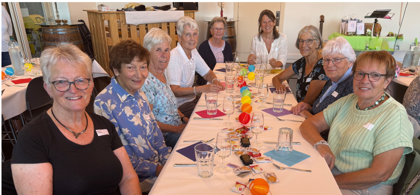
Sammlerinnen von links nach rechts:

Die gesammelten Spenden werden direkt für die Altersarbeit im Kanton Aargau sowie in den Gemeinden eingesetzt. Die Organisation berät Seniorinnen und Senioren kostenlos, unterstützt im Alltag zuhause und stärkt mit gesellschaftlichen Aktivitäten das soziale Netz im Alter – für ein selbstbestimmtes und aktives Leben. Gemeinsam stärker – herzlichen Dank für die grosse Solidarität der Bewohner von Wohlenschwil.