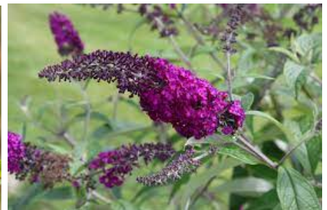
Sommerflieder / Schmetterlingsstrauch