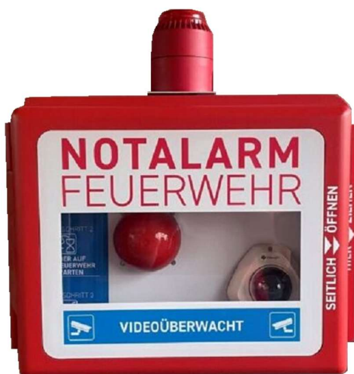
Notalarmbox beim Eingang zum Feuerwehrmagazin Mellingen

Die Feuerwehr Regio Mellingen (Mägenwil, Mellingen, Tägerig und Wohlenschwil) stellt sich der veränderten Risikolage und bietet eine neue Möglichkeit zur Notalarmierung.