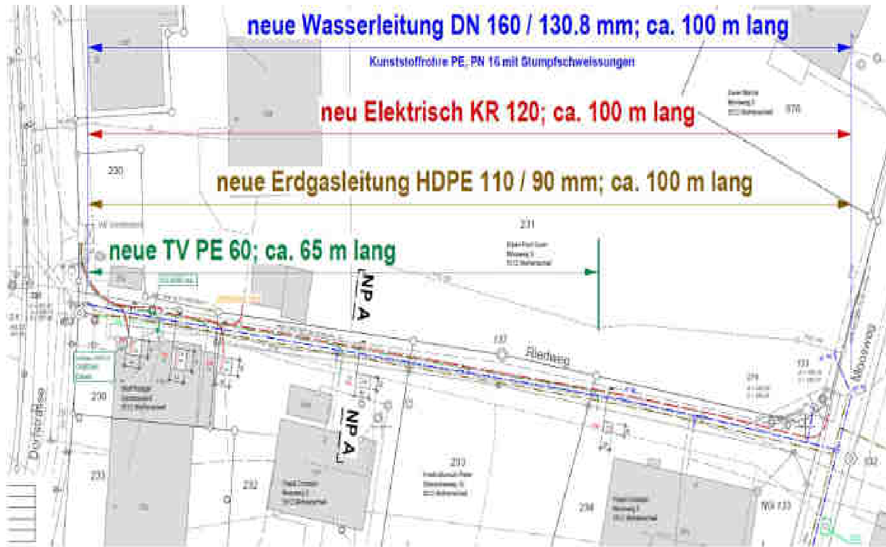
Übersicht Situation Riedweg