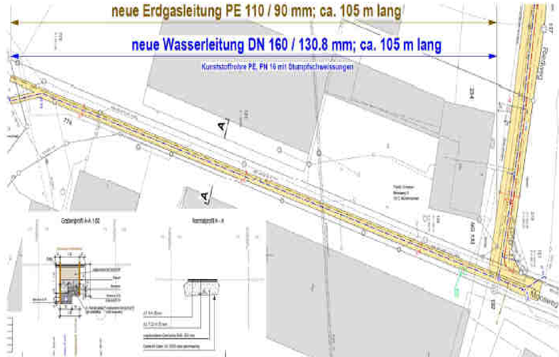
Übersicht Situation Moosweg